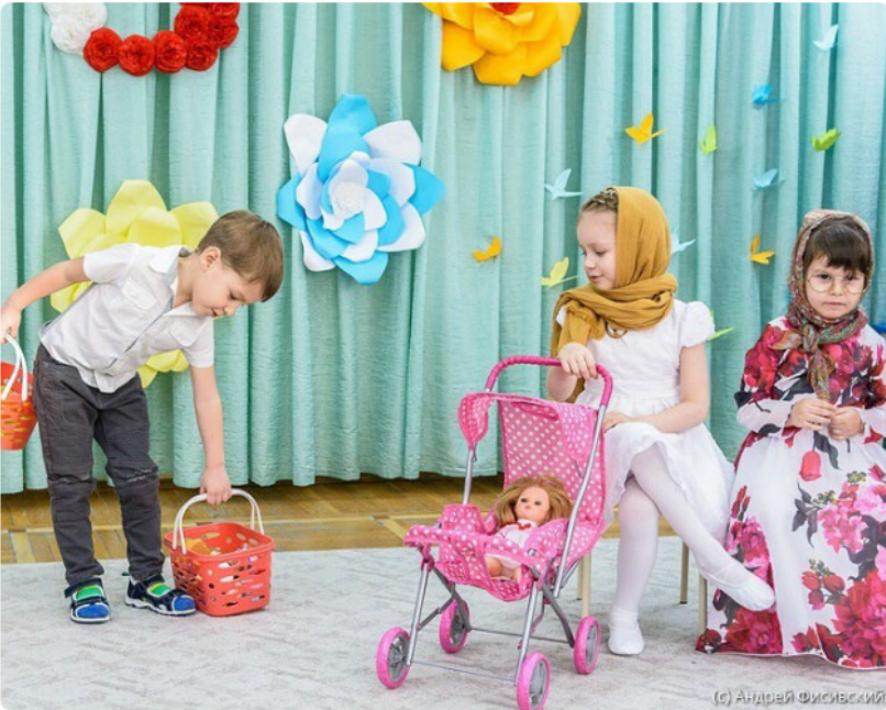
(с) Андрей Фисовский