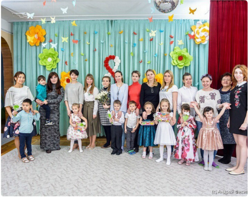
(с) Андрей Фисов